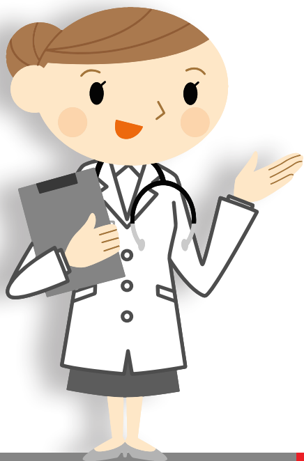
Huisarts / Specialist