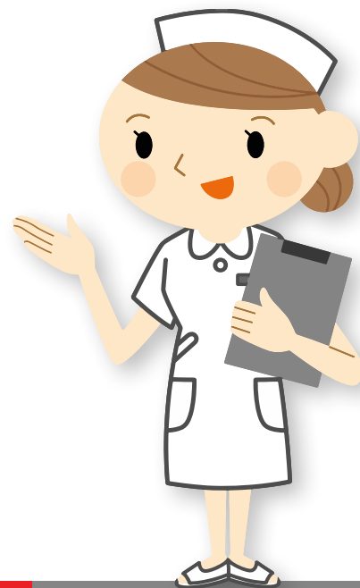
Verpleegkundige / Huisartsassistent